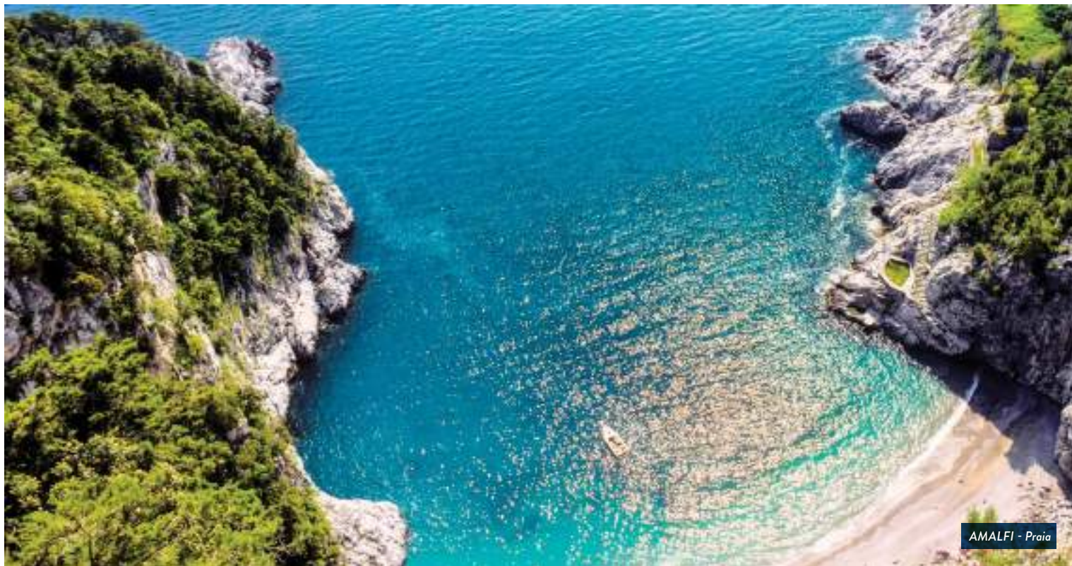
AMALFI - Praia

por volta de 21:00 H (paradas Garantidas na estação Termini/Praça Barberini). Fim dos serviços.