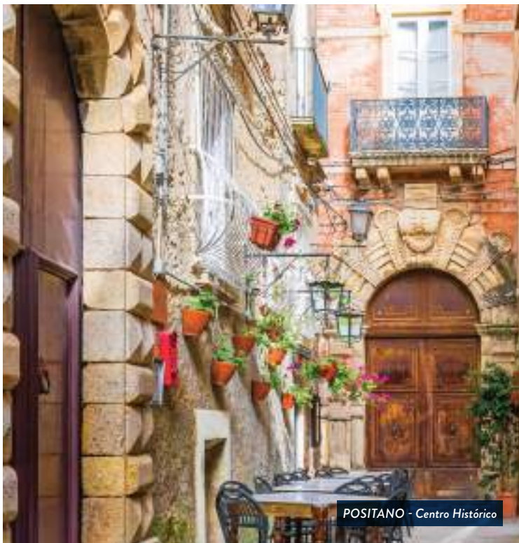
POSITANO - Centro Histórico

Ao chegar em Nápoles o nosso guia local vai nos levar em um passeio a pé pelo centro histórico para admirar a Piazza del Plebiscito, o Palácio Real, a Praça do Município, a Galeria de Umberto I, o Teatro San Carlo. Após do almoço em um restaurante típico com especialidades napoletanas (água mineral e 1 refrigerante incluído) visitaremos as escavações de Pompéia, uma antiga cidade romana que foi destruída pela erupção do Vesúvio em 79 A.C. Esta viagem arqueológica através da cidade antiga lhe dará a oportunidade de entender melhor os romanos que viveram naquela época. Continuação até Sorrento, a porta de entrada para a Costa Amalfitana com o seu colorido centro histórico e o seu belo passeio marítimo com barcos de pescadores e o cais de cruzeiros na Marina grande. Check-in no Hotel em Sorrento, jantar e hospedagem.