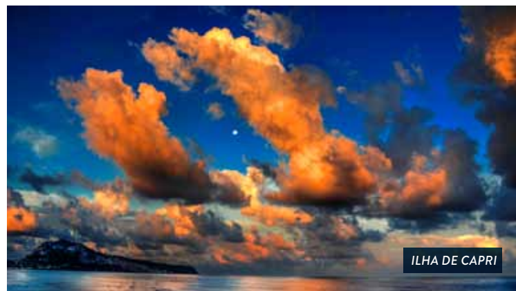
ILHA DE CAPRI

Plebiscito, o Palácio Real, a Praça do Municipio, a Galeria de Umberto I, o Teatro San Carlo. Após do almoço em um restaurante típico com especialidades napoletanas (água mineral e 1 refrigerante incluído) visitaremos as escavações de Pompéia, uma antiga cidade romana que foi destruída pela erupção do Vesúvio em 79 A.C. Esta viagem arqueológica através da cidade antiga lhe dará a oportunidade de entender melhor os romanos que viveram naquela época. Continuação até Sorrento, a porta de entrada para a Costa Amalfitana com o seu colorido centro histórico e o seu belo passeio marítimo com barcos de pescadores e o cais de cruzeiros na Marina grande. Check-in no Hotel em Sorrento, jantar e hospedagem.