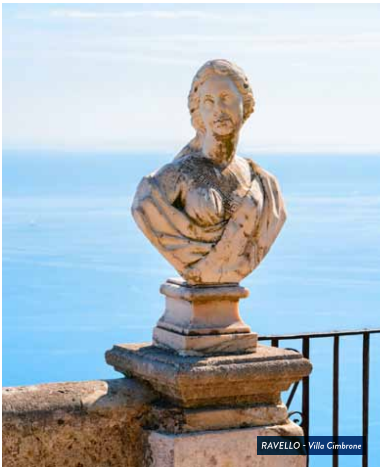
RAVELLO - Villa Cimbrone

NO DIA 7: Hospedagem no centro da cidade