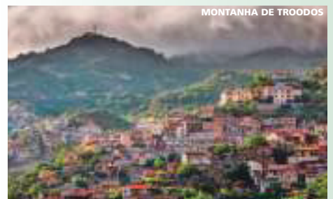
MONTANHA DE TROODOS