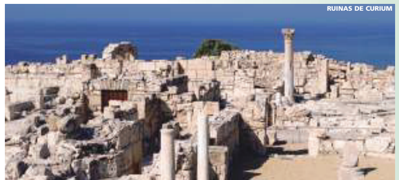
RUÍNAS DE CURIUM