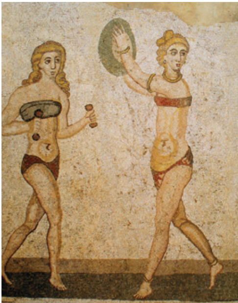
Mosaico, Piazza Armerina