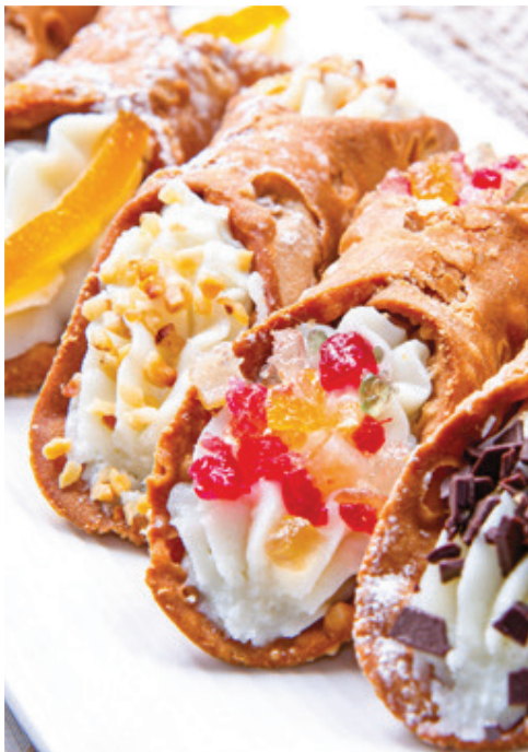
Cannoli da Sicilia