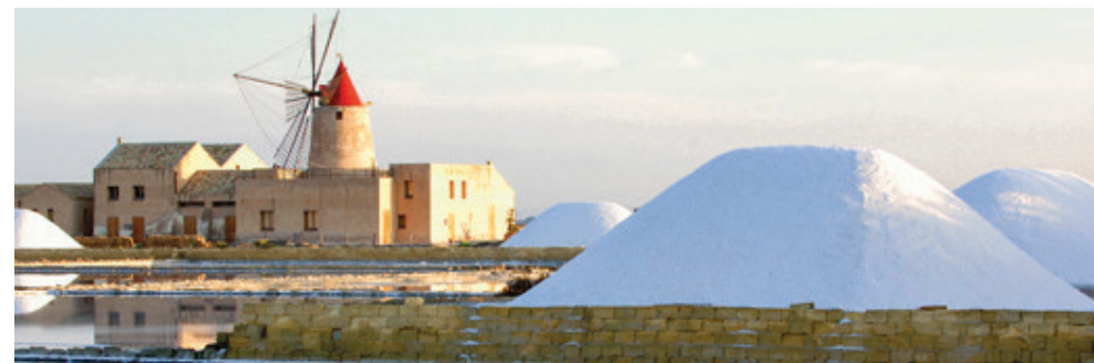
Saline della Laguna